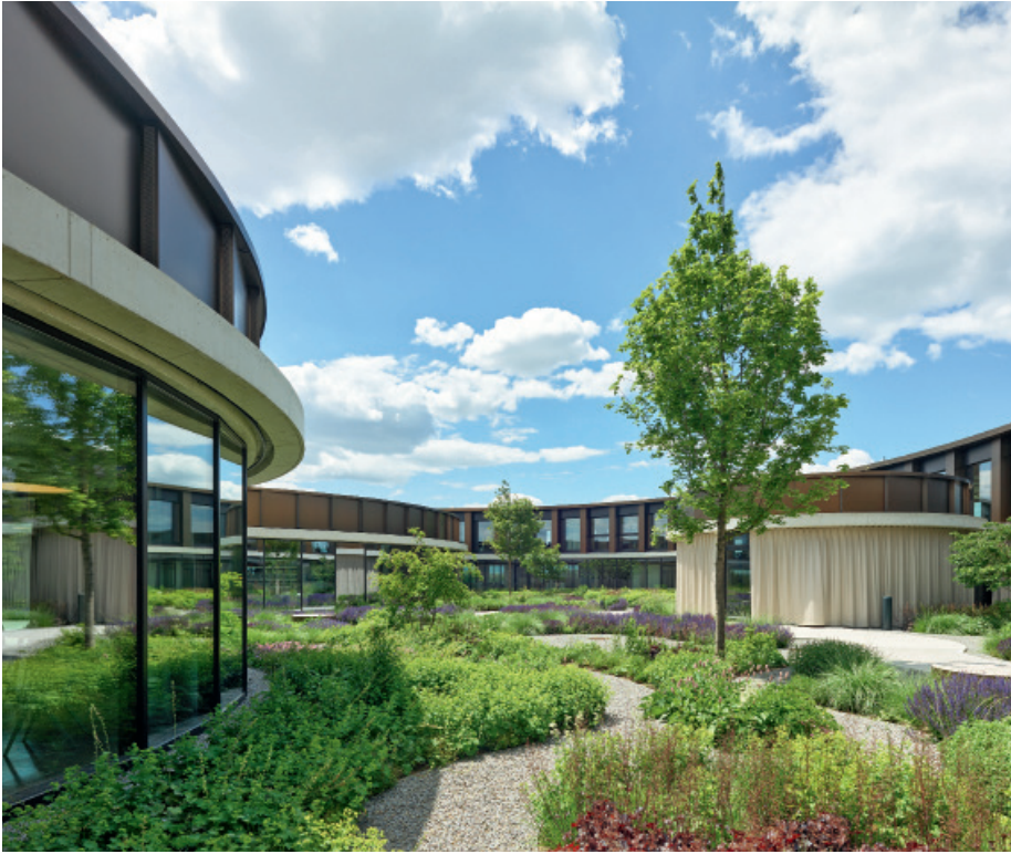
Der begrünte Innenhof