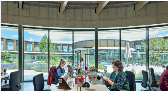
Die Muster- werkstatt