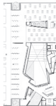
Grundriss Erdgeschoß Besucherteil

Man betritt das Gebäude durch eine kleine Öffnung in der monolithischen Fassade, die den Besucher mit einem monumentalen zentralen Raum verbindet. Diese einem Steinbruch nachempfundene, mit Travertin „Ocean Blue Marble“ verkleidete Agora ist Ausgangspunkt für eine Abfolge mehrerer Ausstellungshallen – jeweils mit unterschiedlichen Materialien bestückt –, die rund um die Agora angeordnet sind. Dieses Konzept löst sich von der Vorstellung traditioneller Einzelhandelsflächen.